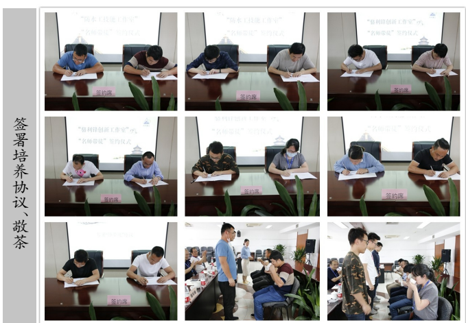
签署培养协议敬茶

企业带来更好的经济效益。希望大家能充分利用好技能工作室的平台,针对技术方案开展各项专业培训,开展各项技能比武,多深入一线,从一线中取得更多的创新技术成果。